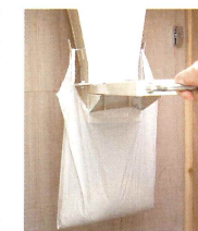
米ヌカ持ち帰り装置