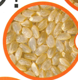
1ぶづき「ヌカ層と胚芽部分の1割程度だけ取り除いた米」