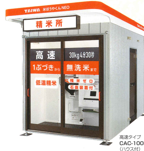
高速タイプ CAC-100BH (ハウス付)