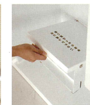
折りたたみ式小袋受台