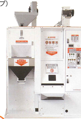
※写真は標準タイプ

既存のハウスにも簡単に組み込めます。お気に入りのハウスを現地で製作、さらに差別化が図れます。(標準タイプ・高速タイプ)