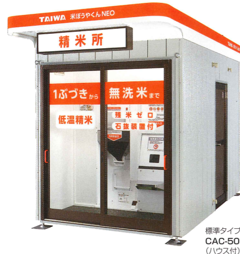
標準タイプ CAC-50BH (ハウス付)