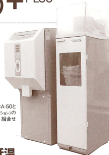
CA-50と ヌカラックA(オプション)の 組合せ

差別化をめざす米穀店、直売店、飲食店、販売農家のみならず おすすめ。コメックネオの採用で、他店にない魅力づくりに!